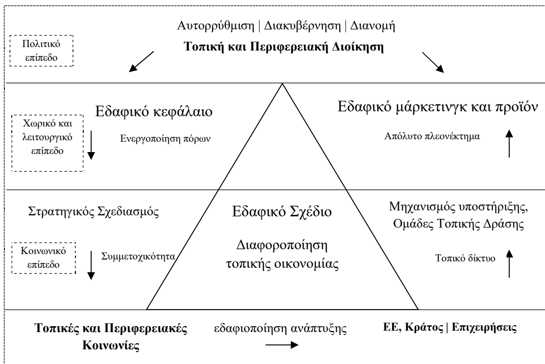
Σχήμα 2. Η αρχιτεκτονική δομή της διαδικασίας εδαφικής ανάπτυξης στην ΕΕ. Πηγή: Ίδια επεξεργασία.

Συνεπώς, ένας σημαντικός παράγοντας επιρροής της διαδικασίας οικονομικής ολοκλήρωσης είναι οι τοπικές και οι περιφερειακές διοικήσεις. Στόχος είναι η βελτίωση της ποιότητας ζωής των τοπικών κοινωνιών στη βάση της κοινωνικής δικαιοσύνης, της οικονομικής ανάπτυξης, της ανάδειξης της πολιτισμικής τους ταυτότητας και της προστασίας του περιβάλλοντος. Σκοπός είναι η διασφάλιση της προόδου σε κοινωνικό, οικονομικό και περιβαλλοντικό επίπεδο, λαμβάνοντας υπ' όψιν τις ιδιαιτερότητες και τις ανάγκες της εκάστοτε εδαφικής περιοχής (CEC, 2008a· Camagni & Capello, 2013· ΤΑ, 2020).